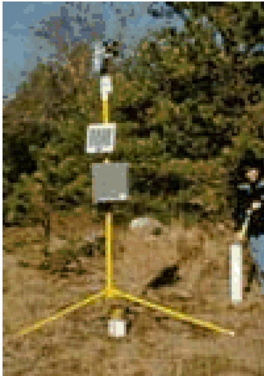
遥感数据采集系统